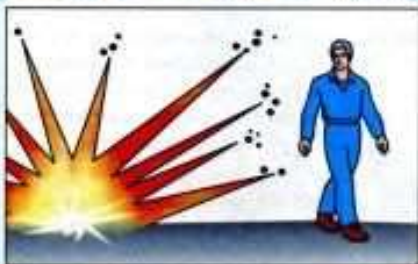
Опасная поза при взрыве